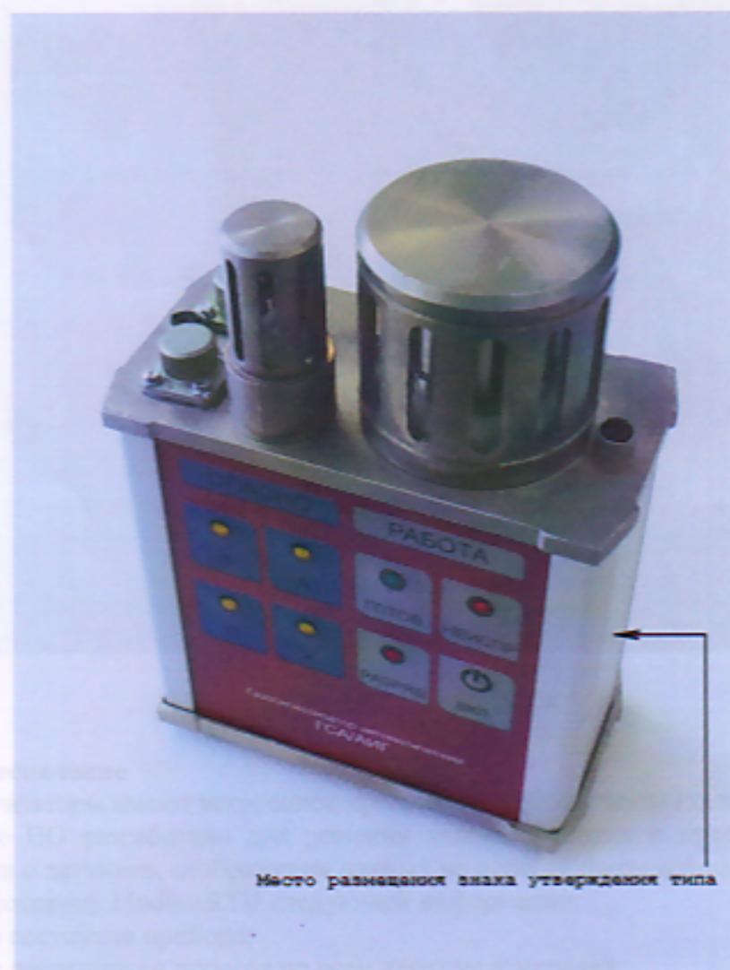
Место размещения знака утверждения типа

Общий вид газосигнализатора представлен на рисунке 1.